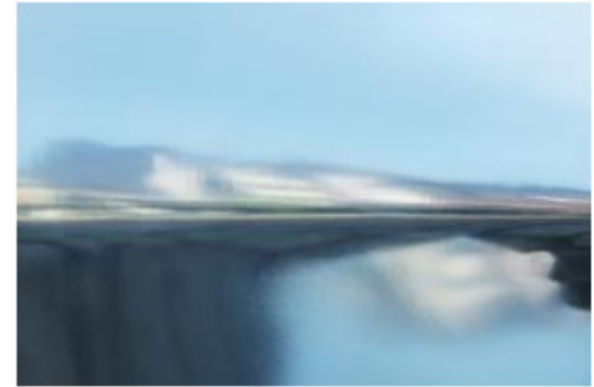
© Dominique Teufen / Courtesy of Christophe Guye Galerie, "Nordic Spring", 2019, Fotografie, 80 × 120 cm