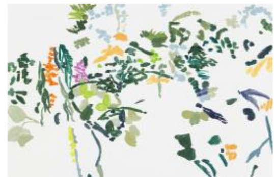
© Bernadette Gruber, "Rainforest IV", 2019, Monotypie, 80 × 120 cm