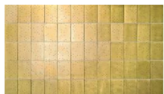
© Ruth Maria Obrist, "Requiem", 2014, Messingplatten, gelocht, 60-teilig, je 26 × 18 cm