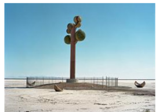
© Tom Haller, "Great Salt Lake Desert", Utah, Fotografie, 105 × 140 cm