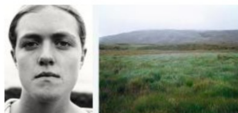
Peter Maurer: 'Faceland', Maighread Rotherham, Aughris, Sligo; Ireland, 2002. 'Faceland', Derrylea, Connemara, Ireland, 2002