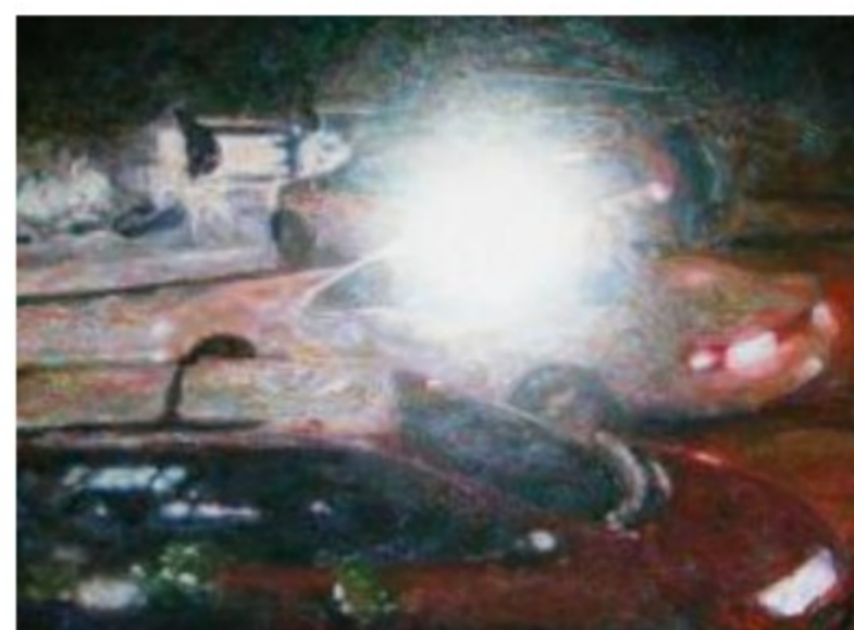
Lukas Salzmann: 'Blind Times 1 (Winter Cars)', 2011. Mixed Media, Leinwand, 120 x 160 cm