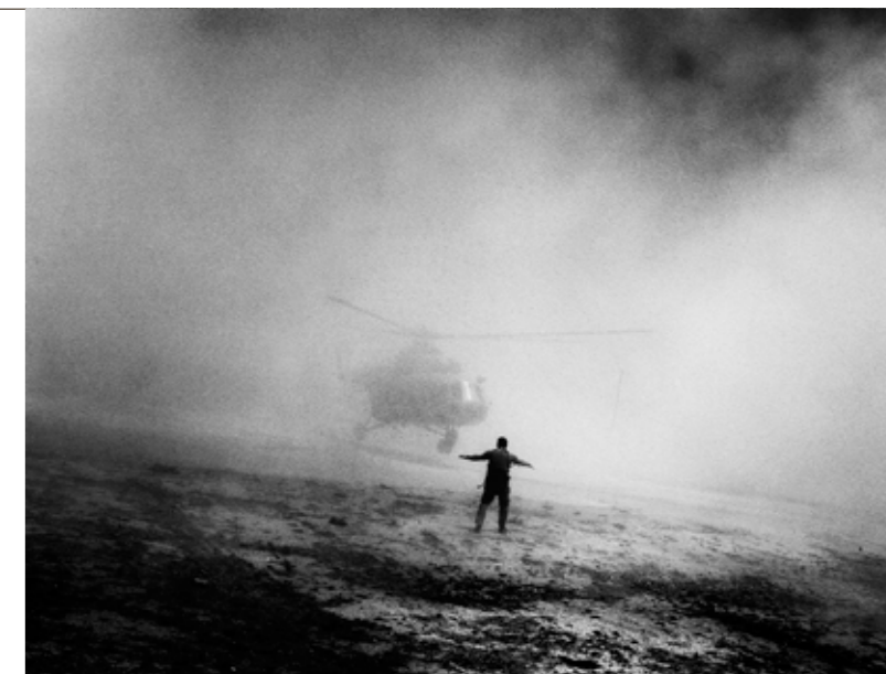
Aktion der afghanischen Polizei in Kabul gegen Drogenschmuggel.