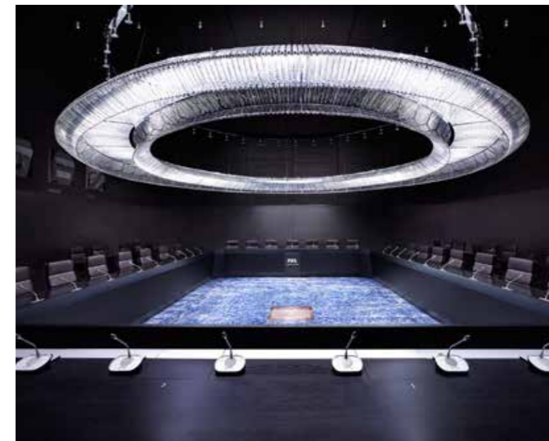
«Executive Room» der Fifa in Zürich.